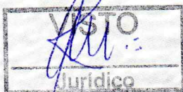
ADELMO DE REZENDE MOREIRA Prefeito Municipal de Capela Nova